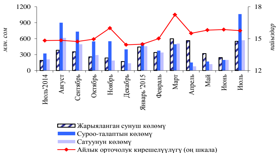
1-график. МКО сунушунун жана суроо-талабынын көлөмүнүн жана кирешелүүлүгүнүн динамикасы

Кароого алынып жаткан мезгил ичинде биринчилик рынокто Кыргыз Республикасынын Финансы министрлигинин казына облигацияларын жайгаштыруу боюнча эки аукцион өткөрүлгөн. Мамлекеттик казына облигацияларынын аукциондорунда жарыяланган эмиссиянын көлөмү өткөн айдын көрсөткүчүнө салыштырганда 2,3 эсе жогорулоо менен 550,0 млн сомду түзгөн. Кароого алынып жаткан мезгил ичинде рыноктун катышуучулары тарабынан 290,0 млн сом суммасына (+45,0 пайыз) 2 жылдык баалуу кагаздар жана 280,0 млн сом суммасына 3 жылдык баалуу кагаздар сатылып алынган. Суроо-талап көлөмү 5,3 эсе жогорулоо менен 1,1 млрд сомду түзгөн.