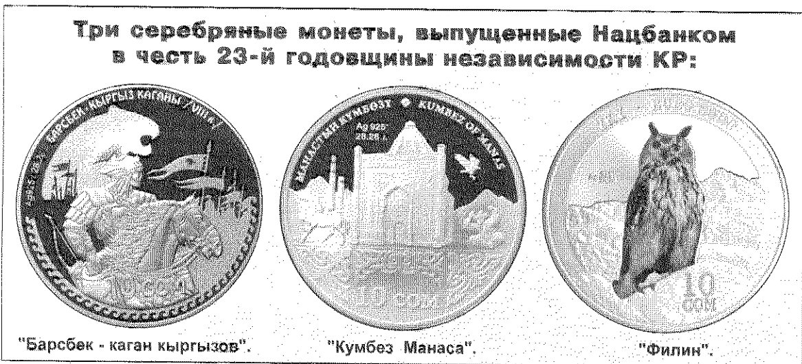
"Барсбек - каган кыргызов".

P.S. С первого сентября 2014 г. Национальный банк КР ввёл в обращение новые 10-сомовые монеты с улучшенными защитными элементами. Как сообщается, дизайн лицевой и оборотной стороны остался прежним, как и год выпуска монет - 2009. Единственным дополнением стали две надписи на боковой поверхности - "он сом" и "10 сом".