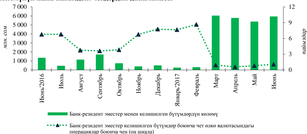
1-таблица. Улуттук валютадагы банктар аралык кредиттердин динамикасы (өөнөттүүлүк боюнча)