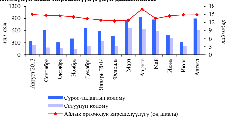
1-график. МКО сунушунун жана суроо-талабынын көлөмүнүн жана кирешелүүлүгүнүн динамикасы

Кароого алынып жаткан мезгил ичинде Кыргыз Республикасынын Финансы министрлигинин казына облигацияларын баштапкы рынокто жайгаштыруу боюнча эки аукцион жана бир кошумча жайгаштыруу ишке ашырылган. Өткөрүлгөн аукциондор боюнча МКОнун жарыяланган эмиссиясынын көлөмү өткөн ай ичиндеги көрсөткүчкө салыштырганда 2 эсеге көбөйүү менен 381,0 млн. сомду түзгөн. Кароого алынып жаткан мезгил ичинде Финансы министрлиги тарабынан жүгүртүү мөөнөтүү 2 жылдык МКОлор гана сунушталган. Жыйынтыгында, рыноктун катышуучулары тарабынан өткөн айдын ушул эле көрсөткүчүнө салыштырганда 2,9 эсеге көбөйүү менен жалпы суммасы 615,0 млн. сомго баалуу кагаздар сатылып алынган. Сатуулар көлөмүнүн ушул сыяктуу жогорулашы – рыноктун катышуучулары тарабынан кызыгуусунун артышынын натыйжасынан болгон. Суроо-талап көлөмү 2,8 эсеге көбөйүү менен 900,0 млн. сомду түзгөн. Мында, канааттандырылган суроо-талап деңгээли 21,5 пайыздык пунктка төмөндөп, 43,9 пайызды түзгөн.