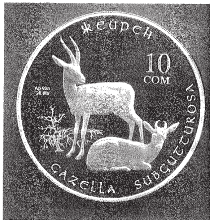
Серебряная монета «Джейран»