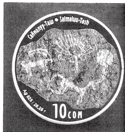
Серебряная монета «Саймалуу-Таш»