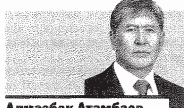
Алмазбек Атамбаев президент Киргизии