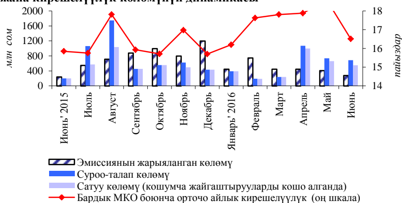
1-график. МКОго карата суроо-талаптын, сунуштун жана кирешелүүлүк көлөмүнүн динамикасы

Ушул айда биринчилик рыногунда Кыргыз Республикасынын Финансы министрлиги тарабынан казына облигацияларын жайгаштыруу боюнча бир аукцион жана бир кошумча жайгаштыруу өткөрүлгөн.