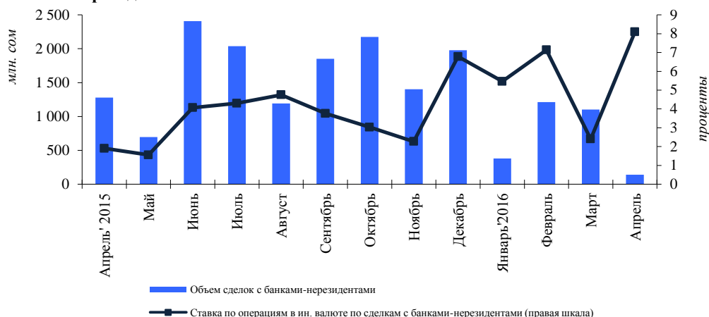
График 2. Динамика объема операций и процентных ставок на межбанковском кредитном рынке по сделкам в иностранной валюте с банками-нерезидентами

Индекс концентрации кредиторов составил 0,49 (+0,28), а индекс концентрации дебиторов – 0,98 (+0,61). Значения данных индексов указывают на высокий уровень концентрации рынка и соответствуют присутствию на рынке двух основных кредиторов и одного заемщика.