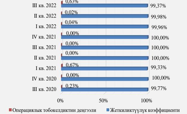
6-график. Бирдиктүү банктар аралык процессинг борборуна операциялык тобокелдиктин жеткиликтүүлүк көрсөткүчүнүн катышы

Улуттук төлөм системаларынын ишине жүргүзүлгөн мониторингдин жана талдап-иликтөөлөрдүн жыйынтыгы боюнча «Элкарт» банктык төлөм карттары менен эсептешүү системасында 2022-жылдын III чейрегинде системанын жеткиликтүүлүк деңгээли 99,37 пайызды түзгөн. Өзгөрүүлөр динамикасы 6-графикте көрсөтүлгөн.