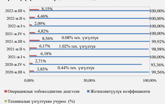
5-график. Пакеттик клиринг системасында жеткиликтүүлүк көрсөткүчүнүн жана операциялык тобокелдиктин катышы

Системадагы операциялык тобокелдиктер. 2022-жылдын III чейрегинде ПКС ишине мониторинг жүргүзүүнүн жыйынтыгы боюнча системанын жеткиликтүүлүк көрсөткүчү 100,00 пайызды түзгөн. Системадагы операциялык тобокелдиктин деңгээли системанын иш регламентинин узартылышына байланыштуу 8,15 пайыз чегинде катталган. Өзгөрүүлөр динамикасы 5-графикте көрсөтүлгөн.