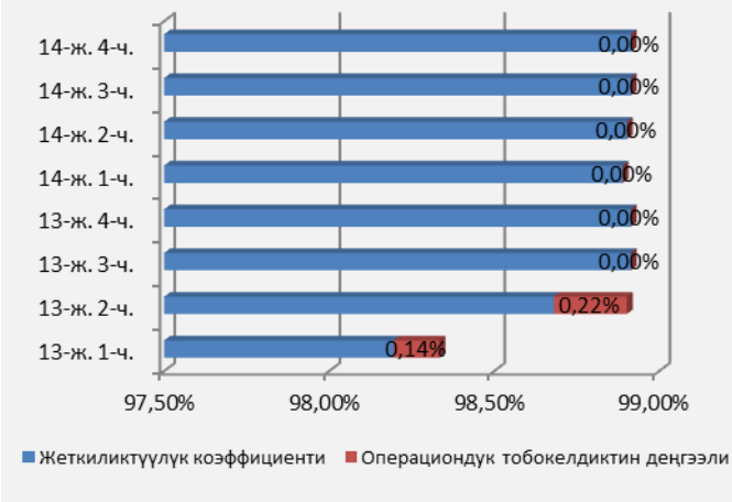
7-график. SWIFT ЖПТдагы жеткиликтүүлүк көрсөткүчү жана операциялык тобокелдиги

SWIFT жамааттык пайдалануу түйүнүнүн эрежелерине ылайык, Улуттук банк банк-катышуучуларга жүргүзүлүп жаткан иштер жөнүндө алдын ала маалымдаган.